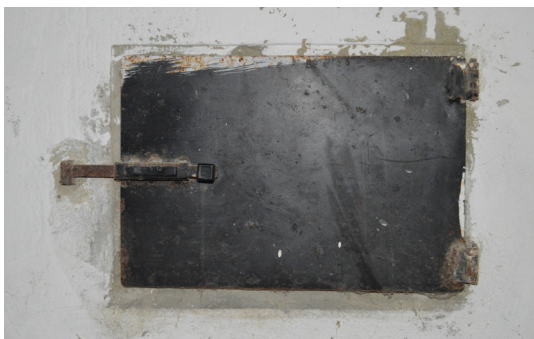
Lo sportellino per la conservazione della cenere

Al locale si accede anche dall'esterno del Convento tramite una scala che apre lungo la strada statale.